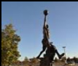
ユナイテッドセンター