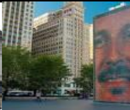
ミレニウム・パーク