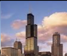
ウィリス・タワー